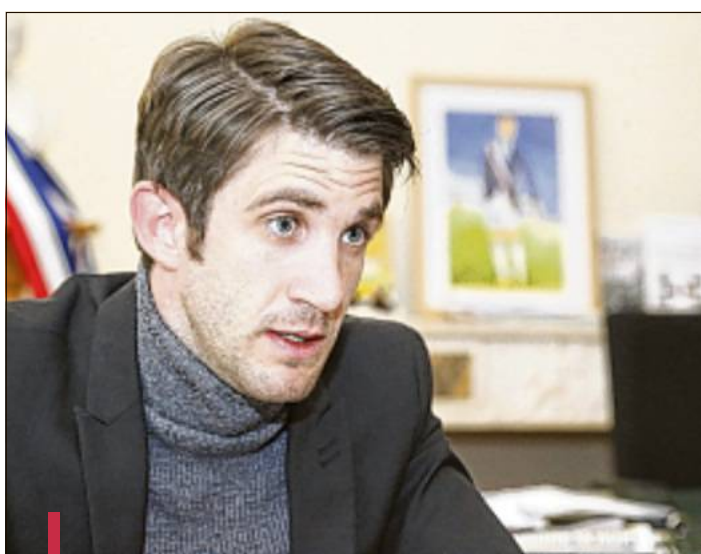
Le maire présentera le budget jeudi.

Parallèlement, "il faudra réduire la masse salariale (de la Ville, NDLR), des départs à la retraite ne seront pas remplacés,